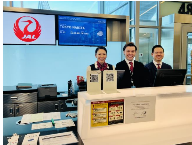
(笑顔でお迎えられるスタッフの方々)