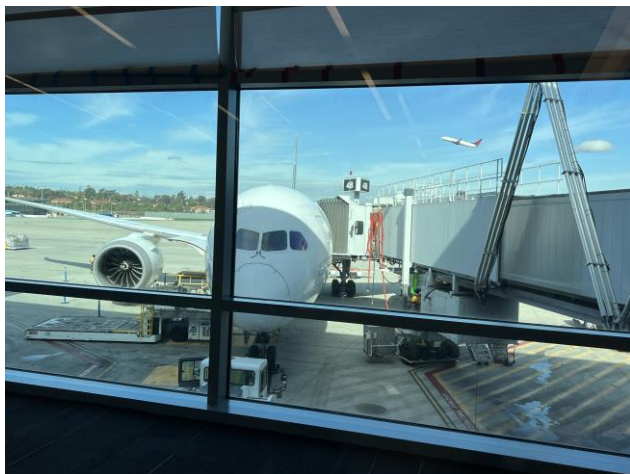
(搭乗口からの眺め)