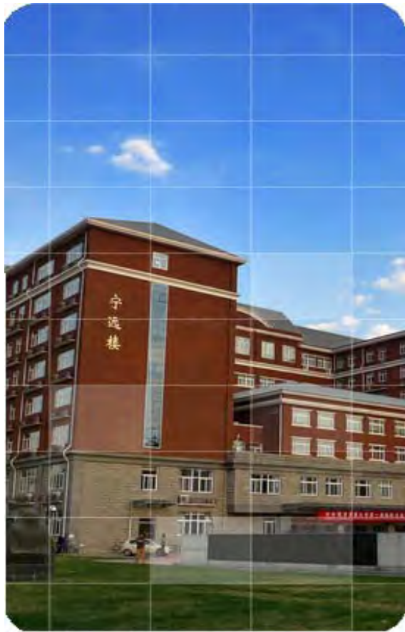
国際経済貿易学院