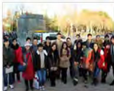
我院2013届西班牙国际本科 班留学记事