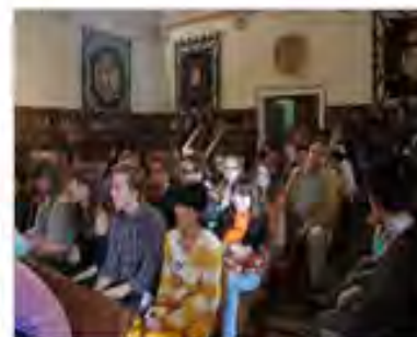
2012年9月四川外语学院成 都学院30名交流生赴西班牙