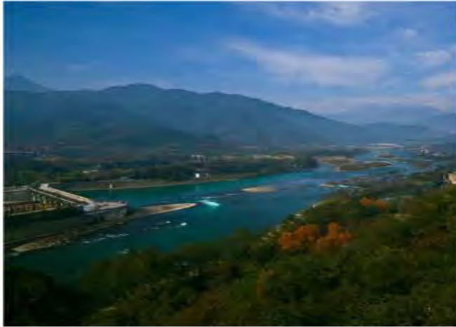
都江堰 とこうえん