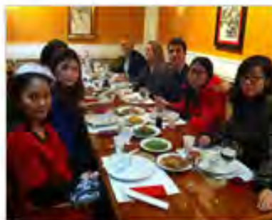
专升本项目学生在科尔多瓦 的第一个新年