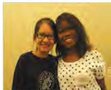
圆梦意大利 造就自信人生 赴 意大利佩鲁贾外国人大学留