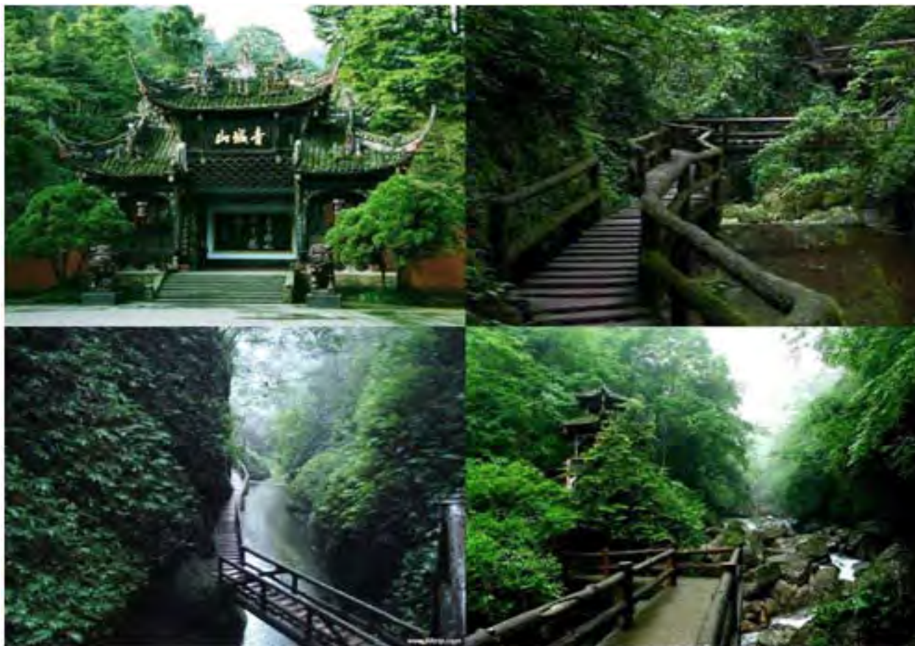
青城山 せいじょうさん