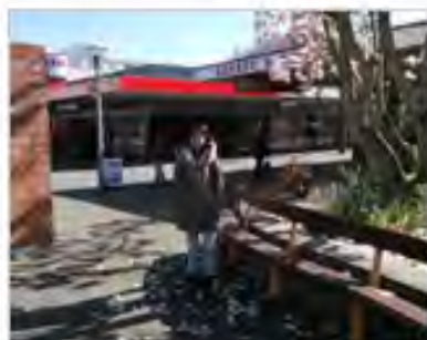
圆梦新西兰 雨夜随想 —— 余栋