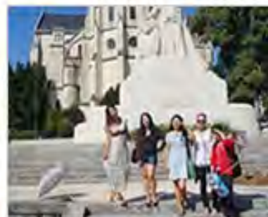
我院法语、英语专业学生赴 法国波城大学留学生活剪影